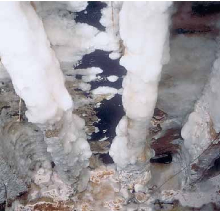
Der Hausschwamm an einer Kellerdecke in Liverpool mit wattigem Myzel und Fruchtkörpern