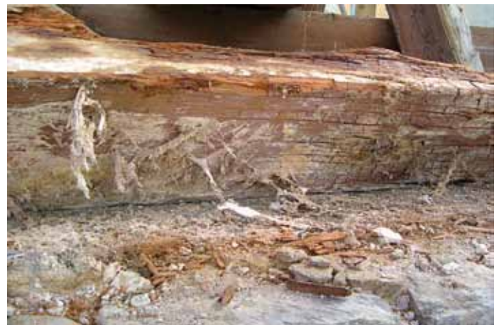
Hausschwambefall mit typischem Würfelbruch (rechts im Bild)

und die Luftfeuchtigkeitswerte nahe der Sättigung liegen 15 .