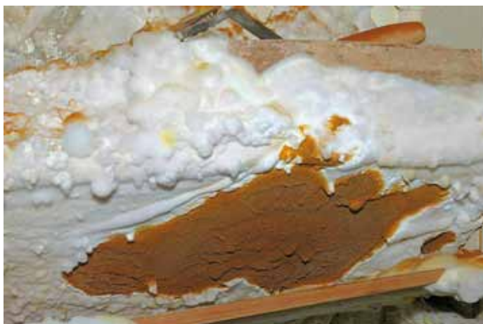
Entstehung eines großen Fruchtkörpers aus dem stranglosen Myzel