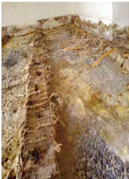
Dicke Stränge auf dem Holz