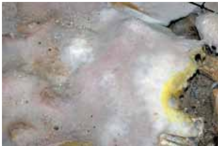
Ein Hausschwamm-Myzel mit der häufig vorkommenden Farbkombination Weiß-Gelb-Burgunder

arten – häufiger der Kleinsporige Kellerschwamm ( Coniophora marginata ) als der Warzige Kellerschwamm ( Coniophora puteana ) – stark durchnässtes Holz zuerst, stirbt aber ab, sobald die Holzfeuchtigkeit sinkt. Jetzt siedelt sich der Hausschwamm an und überwächst den abgestorbenen (oder inaktiven) Kellerschwamm mit seinem Myzel 14 .