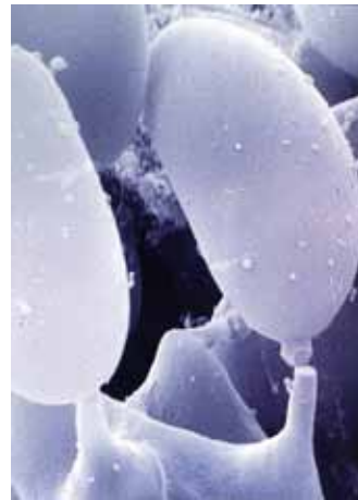
Sporen vom Hausschwamm