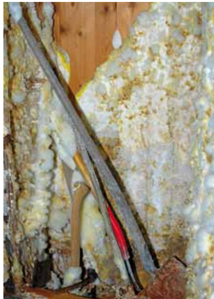
Teppichartig dickes Hausschwamm-Myzel