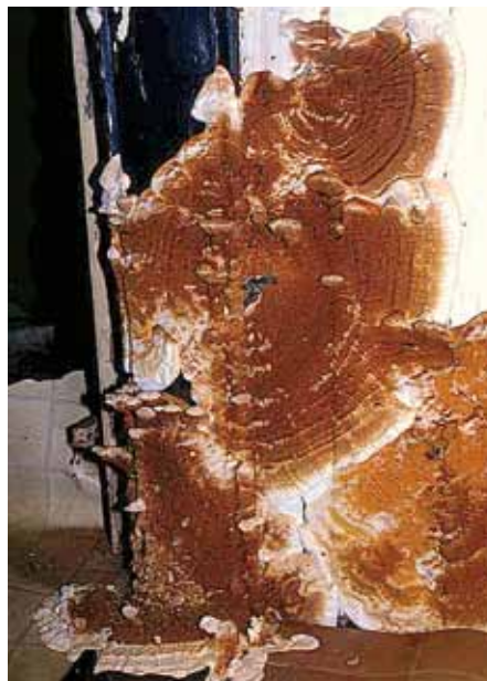
Anliegende und abstehende Fruchtkörper

Myzel heran. Bei Kontakt zweier oder auch mehrerer solcher Keim-Myzelien bildet sich ein sog. dikaryotisches (= zweikerniges) oder polykaryotisches (= vielkerniges) Myzel. Die Keimungen der Spo-