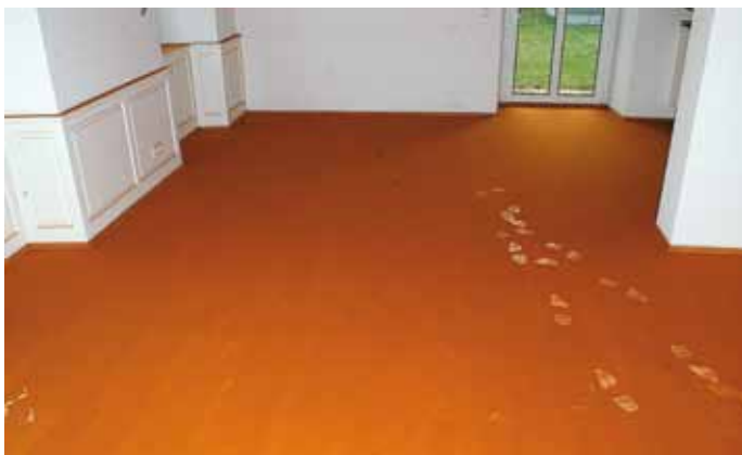
Die Hausschwammsporen bedecken den gesamten Fußboden und alle waagrecht abstehenden Flächen

ren auf Holz können nur erfolgen, wenn die Luft mit Feuchtigkeit nahezu gesättigt ist 6 und das Holz mindestens 30 % Holzfeuchtigkeit enthält. Sie haben größere Erfolgchancen, wenn das Holz zuvor von