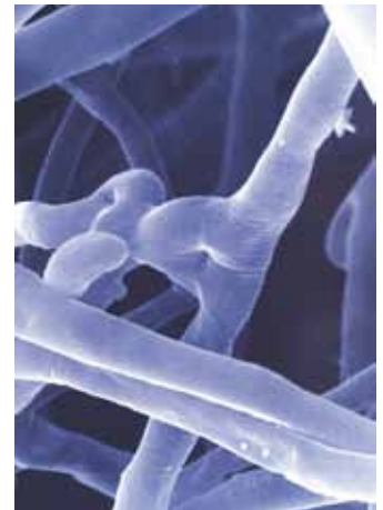
Myzel mit typischen Schnallen