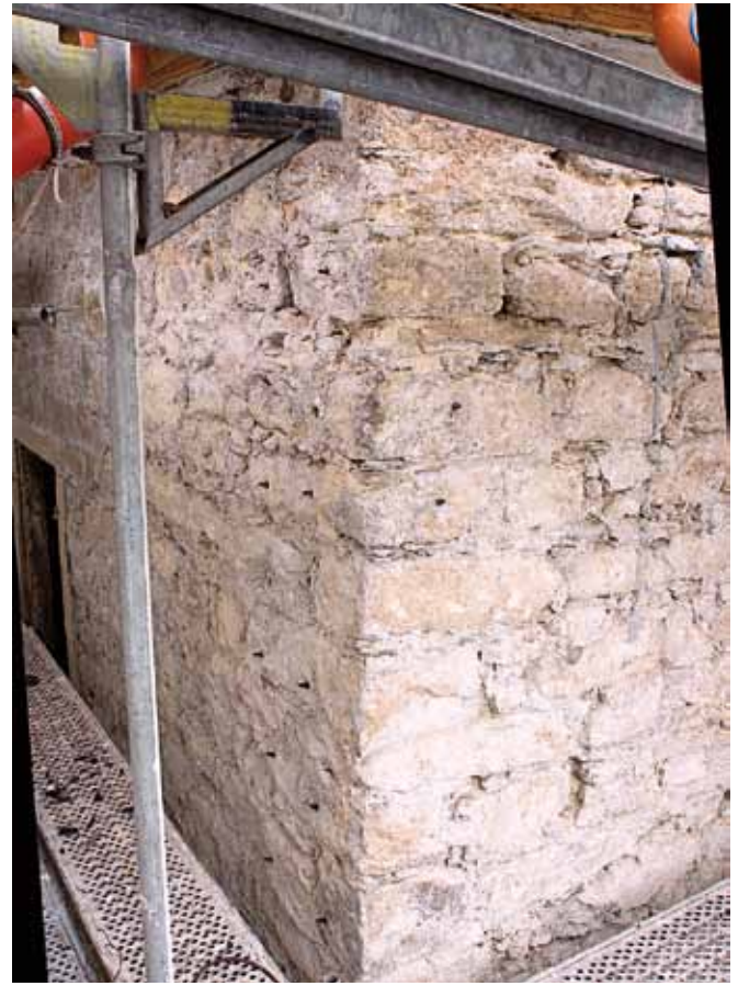
Denkmalgeschütztes Schloss Kirchenlamitz mit überflüssiger und falscher Behandlung der Außenmauern

lichen Kenntnisstand über die Biologie des Hausschwammes und werden deshalb im Folgenden kritisch kommentiert: